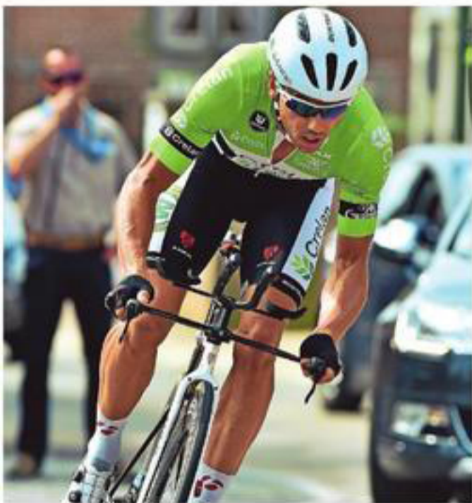
Veldrijder Sven Nys werd - op zeven seconden van de winnaar - knap zevende in de tijdrit.

«Ik heb deze omloop de voorbije weken goed verkend. Ik wist dat ik me tot en met die slotklim wat moest inhouden om niet helemaal stuk te zitten. Ik reed tot nu toe een goede ronde en een dito tijdrit. Dit is veel beter in vergelijking met vorig jaar. Ik vertrek met overschot in Ottenburg, daar wil ik Sven Nys kunnen volgen», klinkt het ambitieus. Sven Nys zette nog een denderende tijd neer maar moest zijn